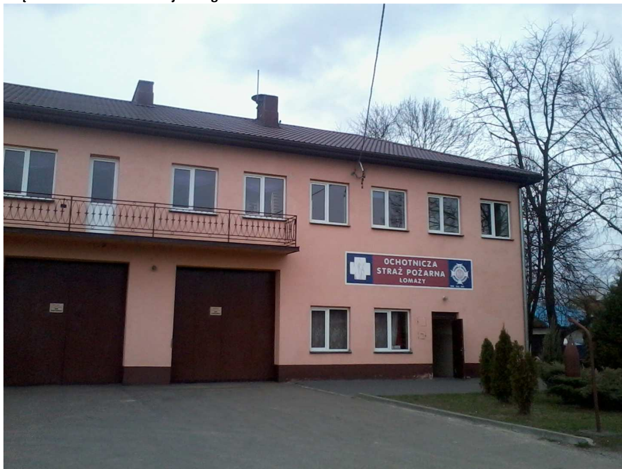
Remiza OSP w Łomazach – stan aktualny