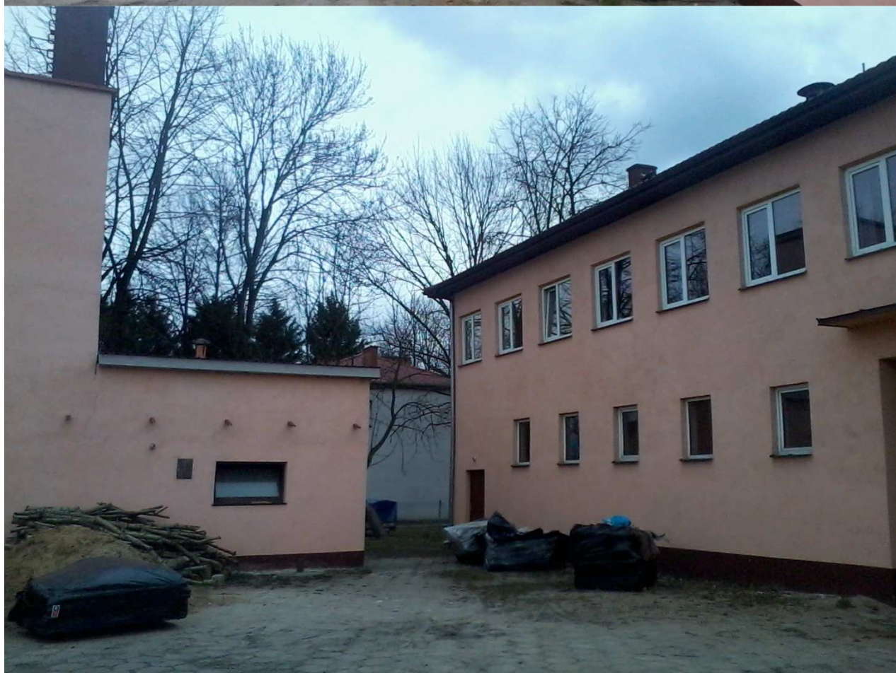
Remiza OSP i budynek kotłowni